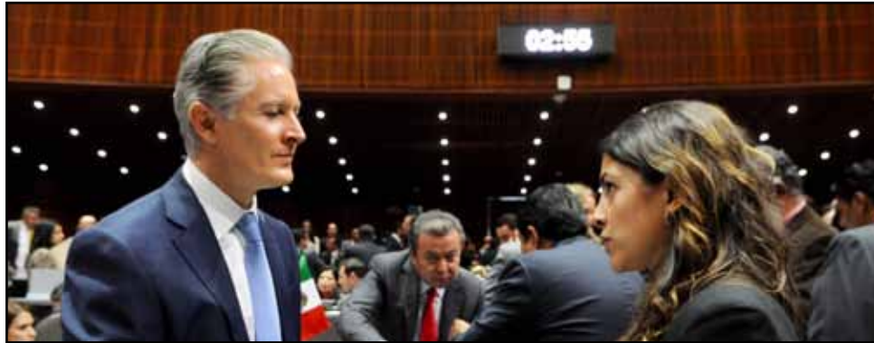
ALFREDO del Mazo con Sylvana Beltrones

Pero aclara que sí está considerado incremento de aproximadamente nueve mil millones de pesos de participaciones y aportaciones, en comparación con 2016, “monto que representa casi el doble de lo aprobado